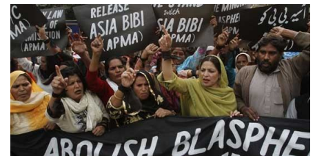
تظاهرات در دفاع از آسیه نورین در پاکستان

اسلامی ها همه زور خودشان را می زنند تا با کمک دولت پاکستان آسیه نورین را به پای چوبه دار ببرند. می خواهند اعدامش کنند تا جواب بشریت معترض از وضع موجود را بدهند. مردمی به پاخاسته علیه ارتجاع اسلامی ترس مرگ در دل اسلامی ها در همه جا انداخته اند و اسلامی ها هم قصد تعرض دارند. جلوی کشته شدن آسیه را بگیریم. هم یک انسان، یک مادر و هسر را نجات داده ایم هم مشیت محکمی به دهان اسلامی ها و دولت پاکستان زده ایم. آسیه و خانواده اش را تنها نگذاریم.*