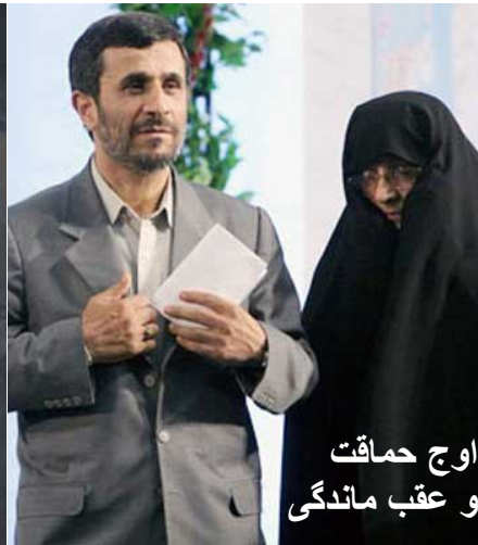
اوج حماقت و عقب ماندگی