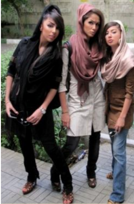
جنگ اضداد. جنگ زندگی و نیستی